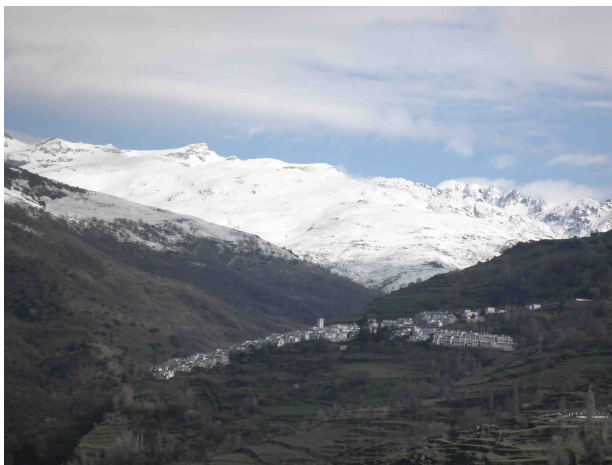
Capileira y Veleta al fondo (24-11-2016)