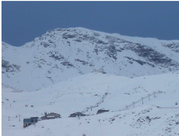
Borreguiles y Tajos de la Virgen (24-11-2016)