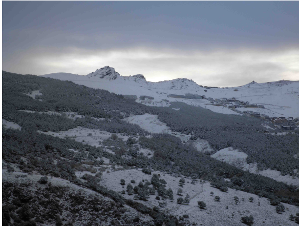
Peñones de San Francisco (24-11-2016)