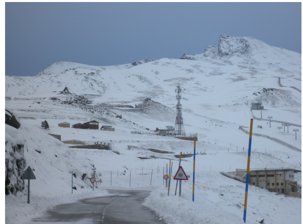
Hoya de la Mora y Veleta (24-11-2016)