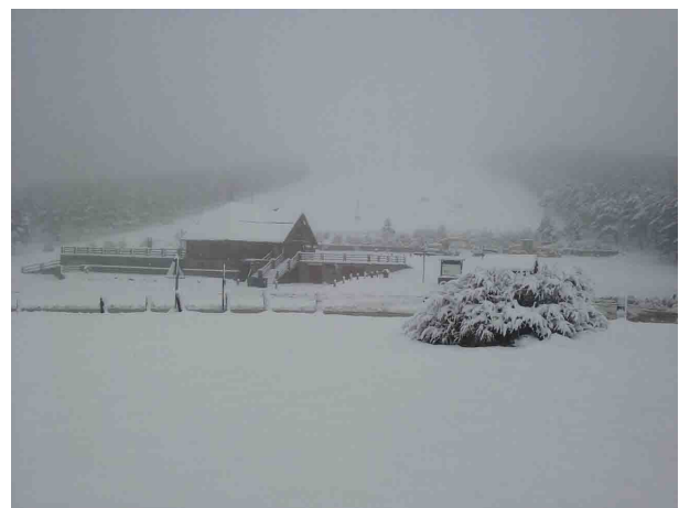
Puerto de la Ragua (24-11-2016)